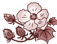
【今月の花】 フヨウ 【花ことば】 繊細な美・富貴